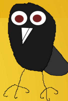
Liva the crow